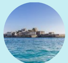
端島(はしま)通称 軍艦島

ジャイロスタビライザー搭載で横揺れも少なく船酔いが心配な方にも安心。広い2階デッキは航行中の写真撮影に最適な空間です。