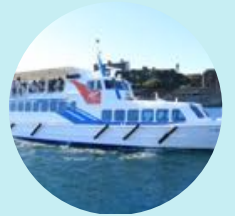
ツアー船「マーキュリー号」

まずはツアーの行程を説明。その後、軍艦島についての歴史を写真やVRなどを使って体感していただきます。